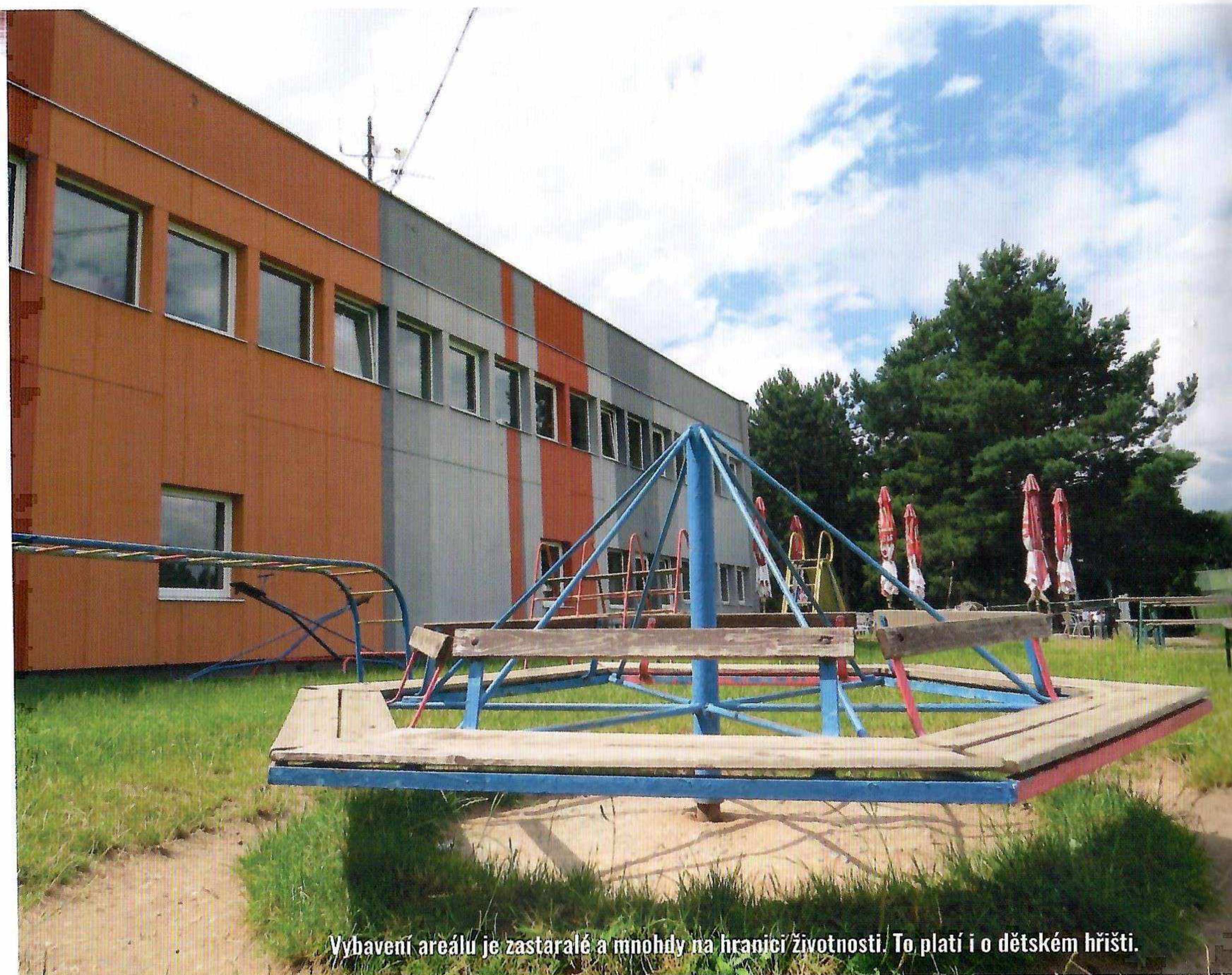
Vybavení areálu je zastaralé a mnohdy na hranici životnosti. To platí i o dětském hřišti.

SK Prosek je největším sportovním klubem na Praze 9 a Praze 18. Byl založen 21. prosince 1966 jako TJ ČKD Kompresory a 1. března 1966 se sloučil s Tatranem Prosek.