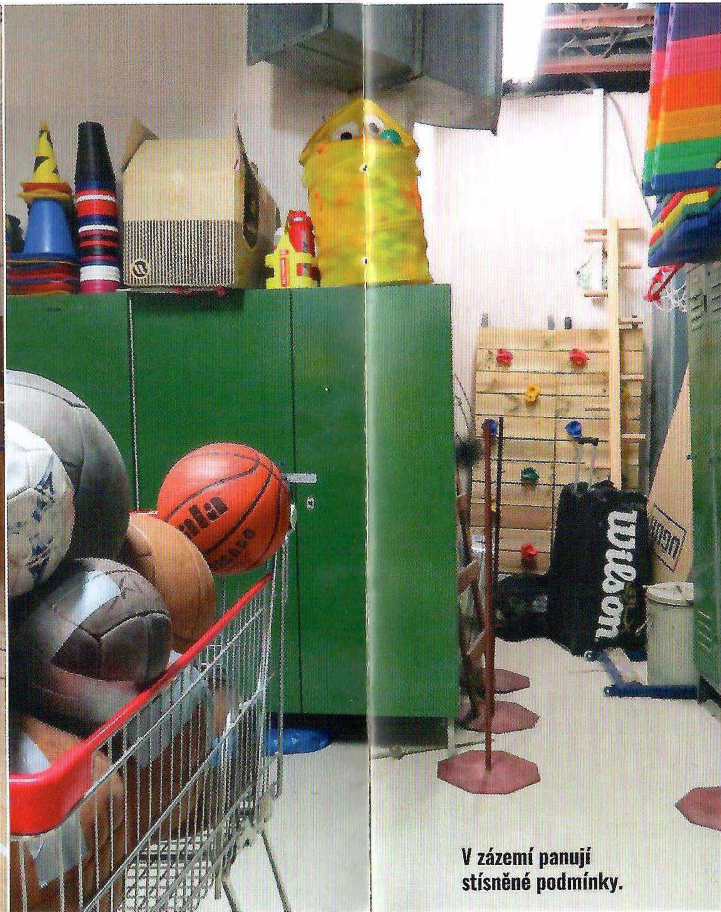
V zázemí panují stísněné podmínky.