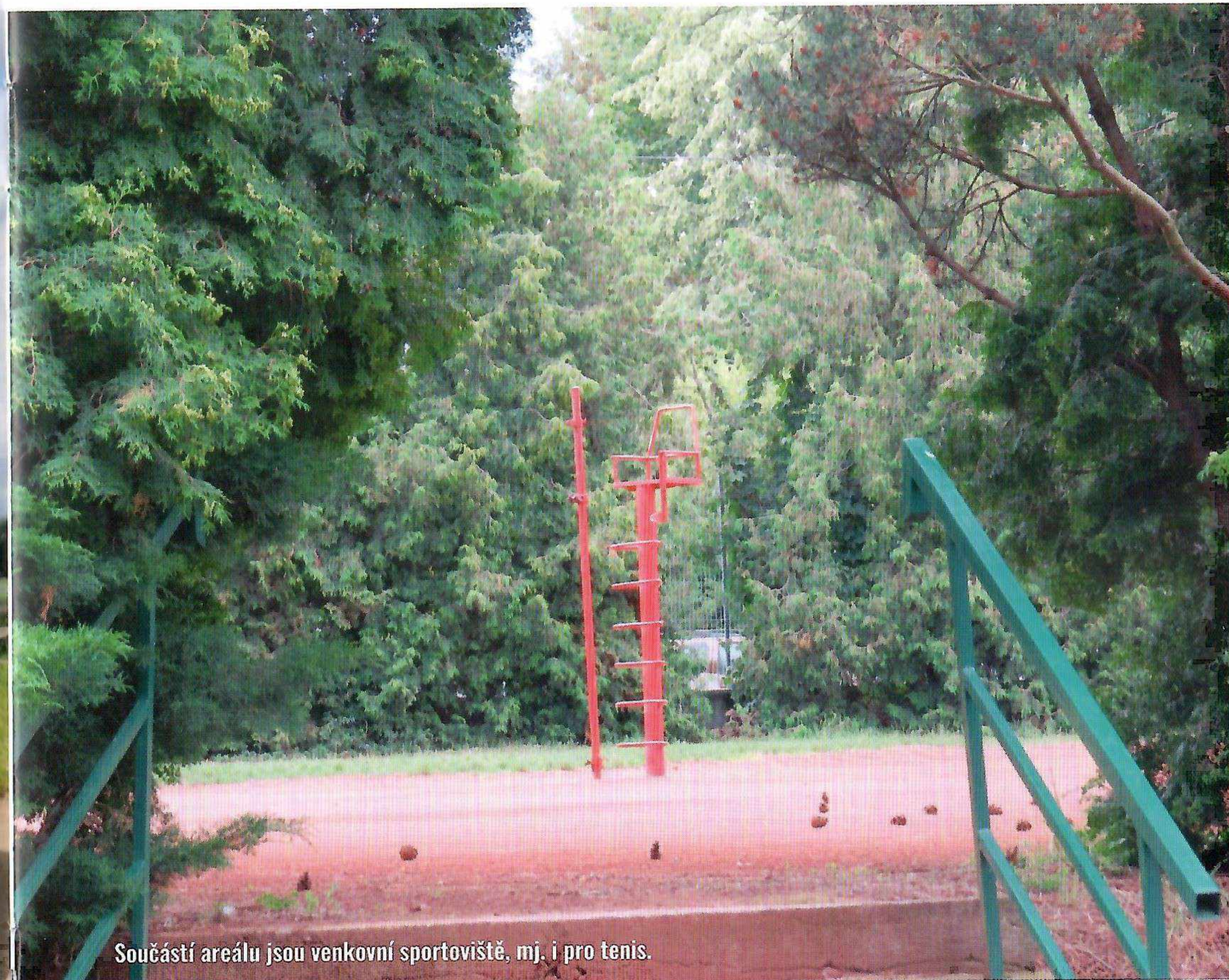
Součástí areálu jsou venkovní sportoviště, mj. i pro tenis.

Podoba areálu, jak ji známe dnes, začala vznikat v druhé polovině sedmdesátých let. I přes zastaralý stav sportovišť zdejší klub dobře funguje. Reprezentuje ho sedm oddílů, v nichž je registrováno přes 700