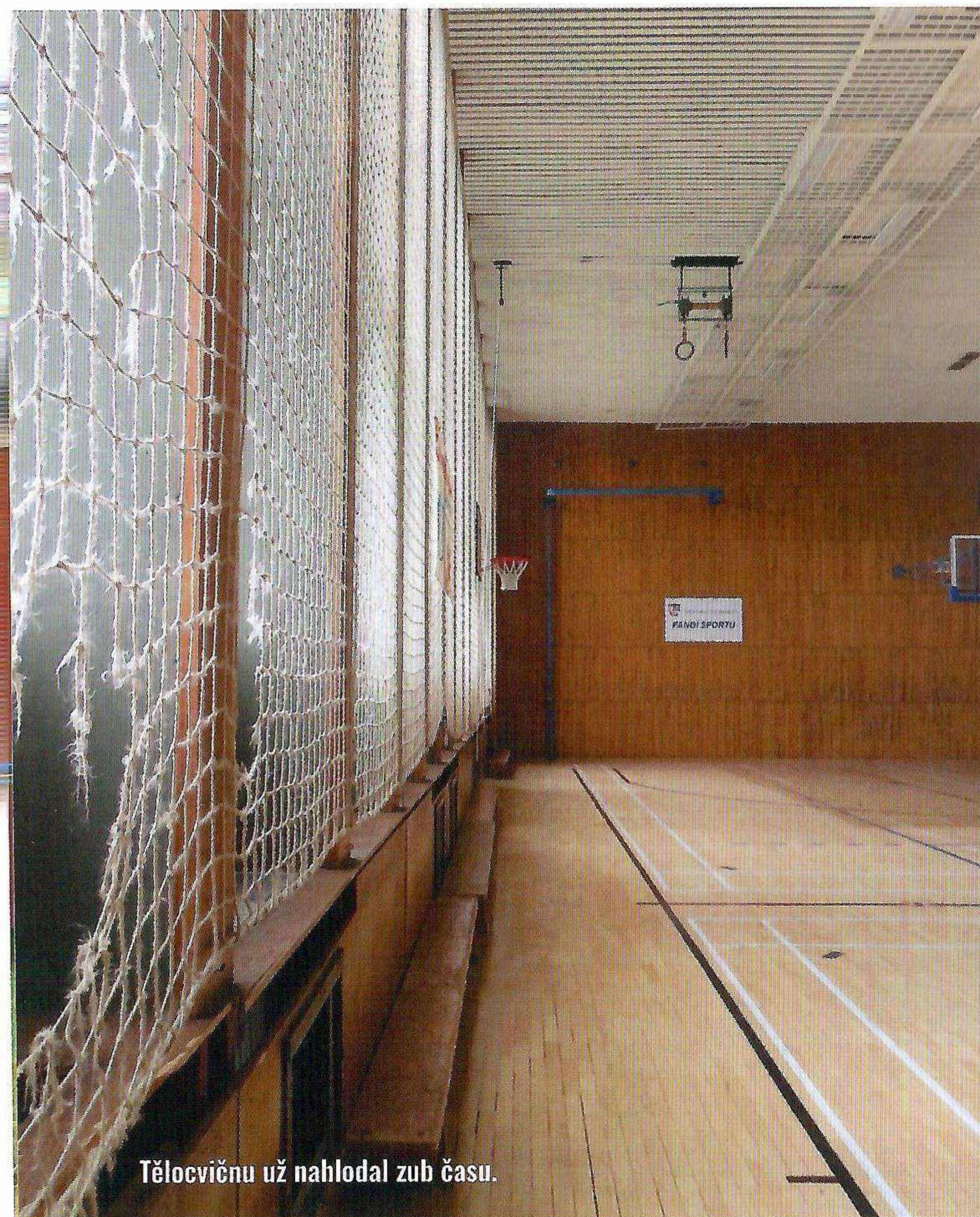
Tělocvičnu už nahlodal zub času.