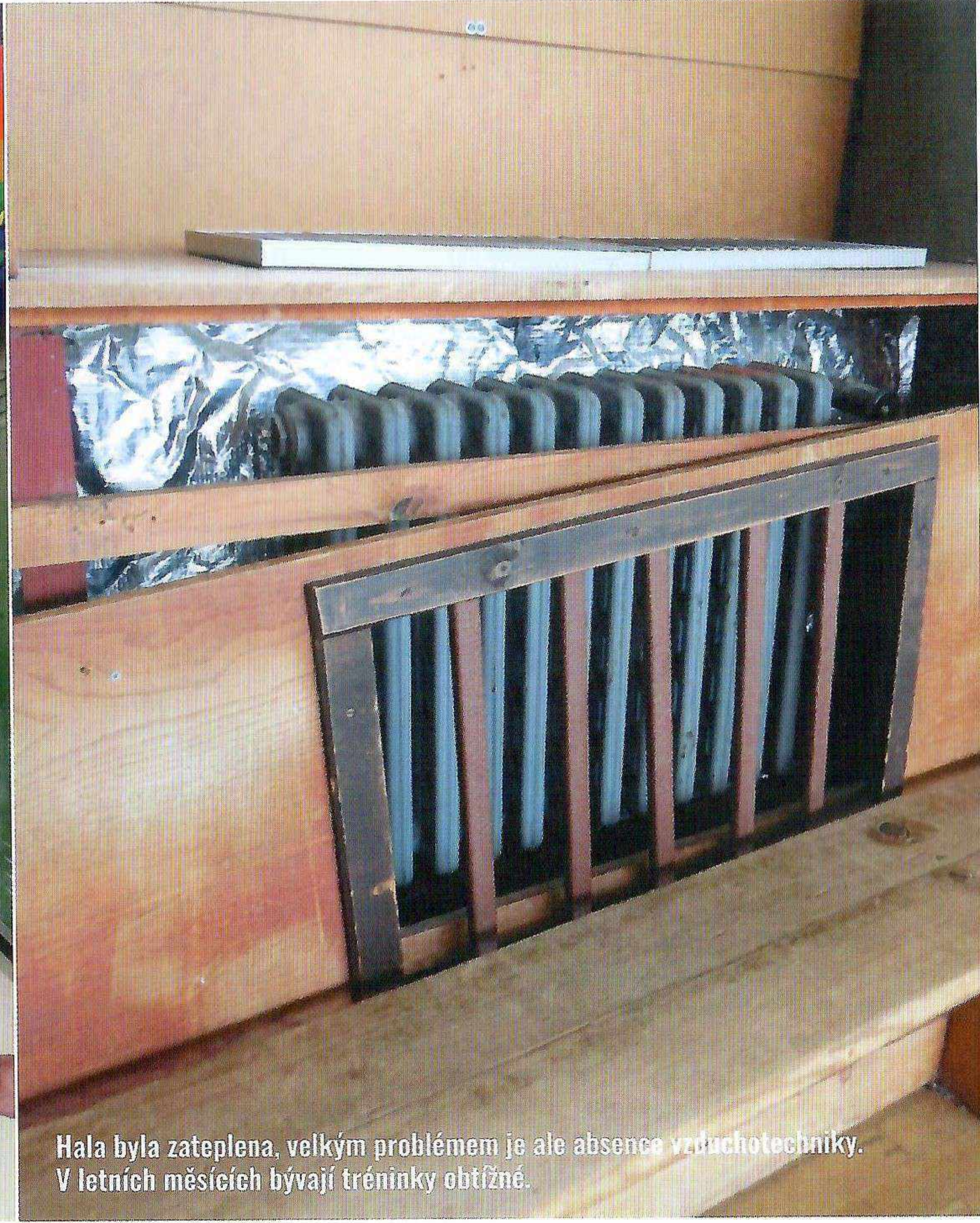
Hala byla zateplena, velkým problémem je ale absence vzduchotechniky. V letních měsících bývají tréninky obtížné.

Pětatřicetiletá hala s tělocvičnou nedokáže kapacitně uspokojit sedm stovek členů sportovního klubu. Sportuje zde ani ne polovina oddílů, ostatní bohužel musejí využívat jiných prostor v okolních školách a jiných sportovištích.